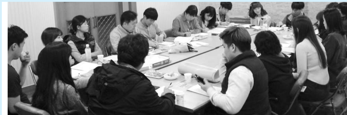
▲ 장애인식개선 캠페인 회의