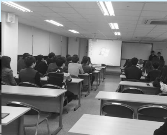
▲ 너나들이 정기총회