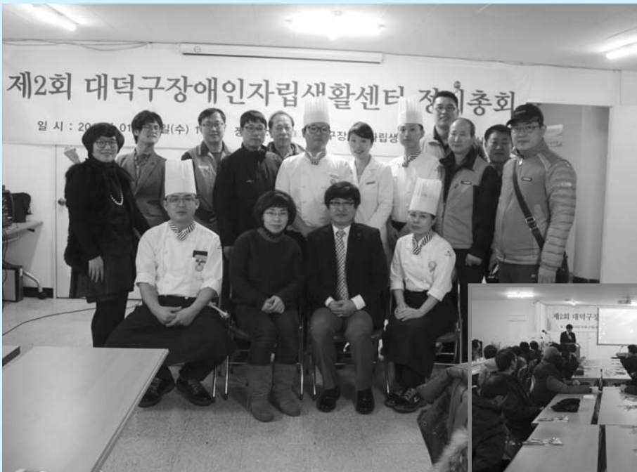
◀ 제2회 정기총회